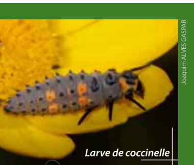
Larve de coccinelle

► Les micro-organismes pathogènes (bactéries, champignons, virus) infectent leur hôte, ce qui provoque un affaiblissement de l'hôte, voire sa mort.